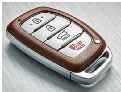
Chave e documentação

O Concessionário HMB terá a faculdade de avaliar o veículo em cada caso concreto e rejeitá-lo, contanto que baseado em decisão fundamentada e alinhada com os critérios ora estabelecidos.